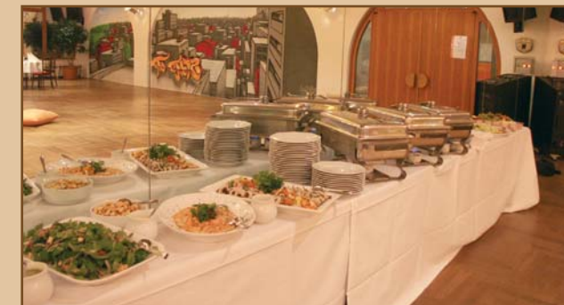
Loft 6, 245 m 2 mit Buffet.

Neben den klassischen Tagungsarrangements mit Kaffeepausen und Lunchbuffet realisieren wir gern Ihre ganz individuellen Wünsche . Ob Candlelight-Dinner, Fingerfood, Salat-, Vorspeisen-, Pasta- und Dessertvariationen – deftig oder kalorienbewusst – unser Küchenchef macht es möglich!