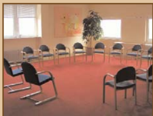
Loft A1, 70 m 2 , abdunkelbar

... haben Sie im MeridianSpa Wandsbek auf 15.000 m 2 die optimalen Voraussetzungen, damit Ihre Veranstaltung zum Erfolg wird. Jeder Anlass findet hier seinen Raum.