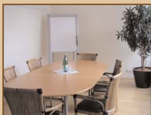
Gruppenarbeitsraum, 20 m 2

Ausstattung und technisches Equipment stellen wir nach Ihren Wünschen bereit.