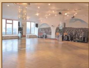
Loft 6, 245 m 2