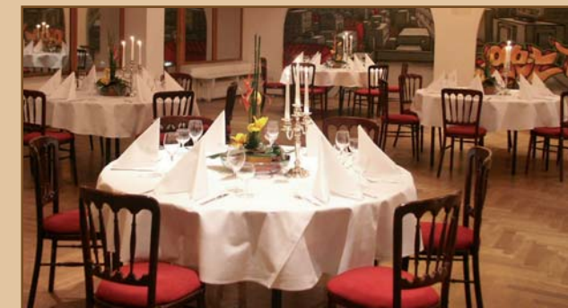
Loft 6, eingedeckt zum Dinner für 30 Personen.